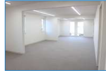
3F オフィススペース