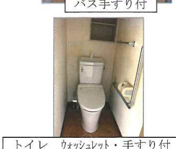
トイレ ウォッシュレット・手すり付