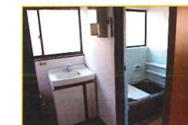
洗面・脱衣所・お風呂