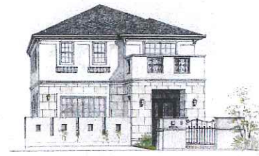
※参考イメージパースです